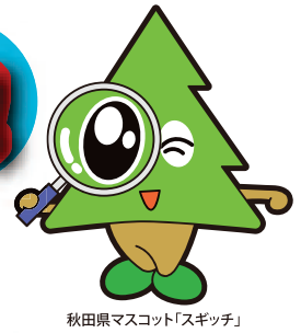
秋田県マスコット「スキッチ」

秋田県にある3つのジオパーク(八峰白神、男鹿半島・大湯、ゆざわ)が大集合 ジオパークの世界をアルヴェで満喫! 親子で発見! みんなで体験!