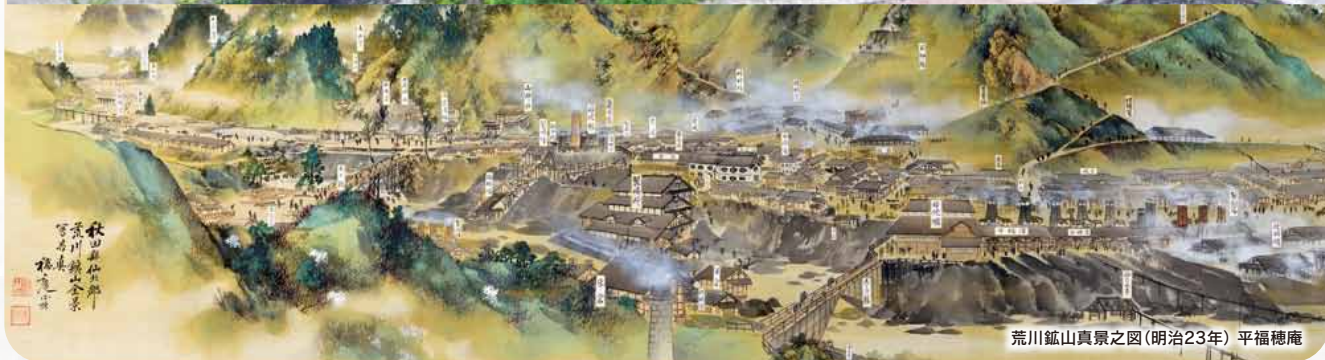
荒川鉱山真景之図(明治23年) 平福穂庵